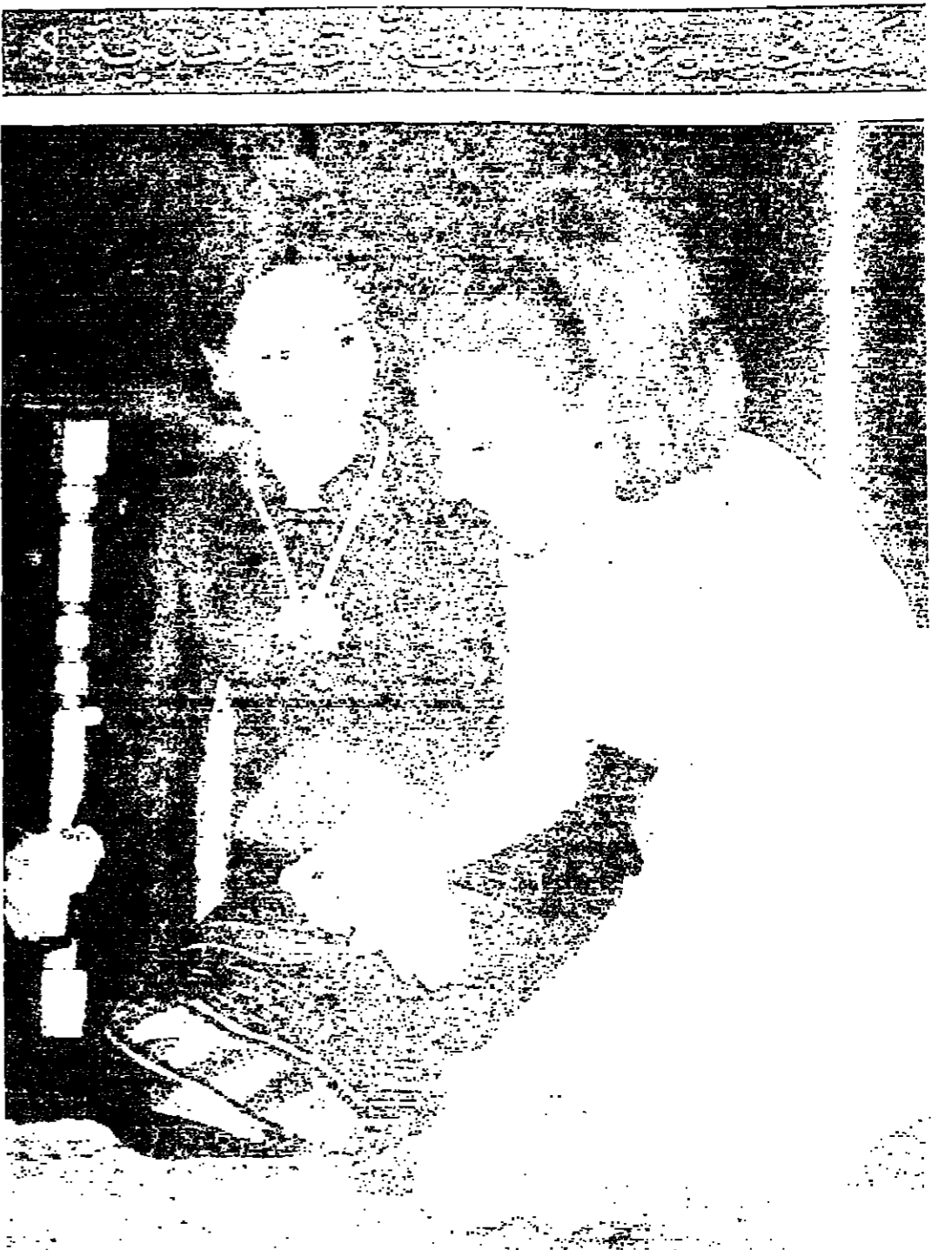
المثلة بريجيت بارود في فيلمها الجديد «شالكو» الذي يروي قصة حياة رعاة البقر في اميرالطورا فوج اميرالطورا ايران كيمية الجوس على الطريقة الثلاثية خلال زيارة شاه ايران والاميرالطورا الفلامد

ميونخ - روبرت - قال البوليس ان مظاهرات كاثوا يصحسون « فيتنام ٠٠٠ حرية .. اليونان » حضوا نواذب القصف اليونانية هنا بالمجازرة ليلة امس الاول واقتضوا جرحاها بطلا امس . واقتضوا البوليس عددا من المتظاهرين الذين بلغ عددهم ١٢٠ شخصا لكن لم يوجه لهم اية اتهامات .